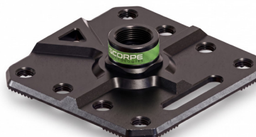
Fix 300 Base 2,8 kg 30x30x5,8 cm