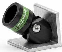
L Base 2 kg 15x13x10 cm