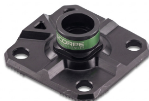
Fix 200 Base 1,1 kg 20x20x5,8 cm