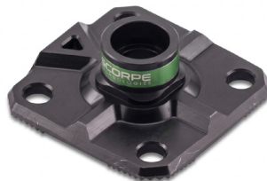
Fix 200 Base 1,1 kg 20x20x5,8 cm