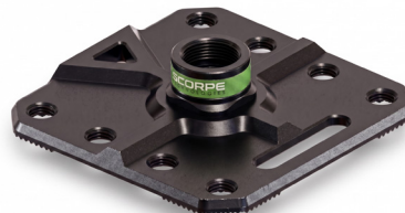
Fix 300 Base 2,8 kg 30x30x5,8 cm