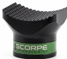
Concave Head 0,8 kg 12x8x8 cm