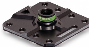
Fix 300 Base 2,8 kg 30x30x5,8 cm