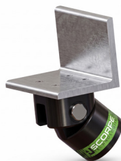
L Head 1,8 kg 15x10x20 cm