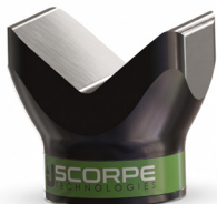
V Head 1,1 kg 10x8x10,5 cm