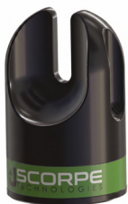
Chain Head 0,7 kg 7,6x7,6x12 cm