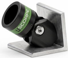
L Base 2 kg 15x13x10 cm