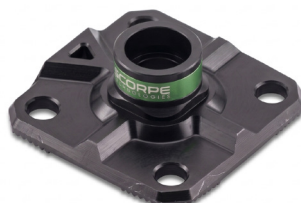
Fix 200 Base 1,1 kg 20x20x5,8 cm