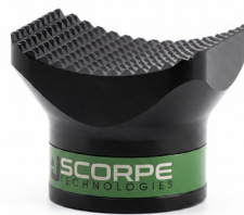
Concave Head 0,8 kg 12x8x8 cm